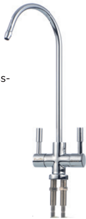
2-Wege-Zapfhahn für gefiltertes sowie reines Wasser

JUDO Bioquell®-PURE stellt eine zuverlässige Versorgung mit sauberem, klarem und geruchlosem Trinkwasser sicher. Das System benötigt keinen zusätzlichen Lagertank, ist daher besonders platzsparend und sorgt für einen stagnationsfreien hygienischen Betrieb. Die Filter lassen sich durch das Schnellverschluss-system ganz einfach wechseln. Das Untertisch-System eignet sich für die Behandlung von klarem, farblosem, eisen- und manganfreiem Trinkwasser.